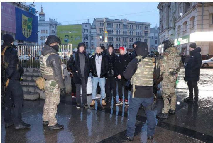
Затримані учасники масових заворушень у Харкові.

З Росії всеохопна манія довкола «ПВК Редан» перекочувала за кордон, навіть в Україні знайшлися ті, хто ведеться на підозрілі Telegram-канали із закликами до молодих людей брати участь у бійках. При чому масово об'єднуватися в Україні почали не лише реданівці, а і їхні противники, які називають себе «АнтиРедан». Планування класичне: розподіл на групи, вибір точок зборів, інформатори на місцях. Основними центрами проведення зустрічей, як і в Росії, є людні місця на кшталт площ, торговельних центрів, центральних частин міст тощо. Так, 26 та 27 лютого 2023 року правоохоронці запобігли заворушенням у кількох великих містах. У Києві планувалась сутичка на Печерську, у Львові відбувались провокації біля ТЦ «Форум». У Харкові, Івано-Франківську, Луцьку, Житомирі десятки людей також намагались влаштувати бійки. Серед учасників заворушень багато неповнолітніх. Наприклад, серед затриманих 257 людей у Харкові лише 30 були старше 18 років. «У багатьох вилучено балончики з газом, ножі, кастети... Всі неповнолітні будуть передані батькам, за участю повнолітніх будуть проведені слідчі дії, направлені на встановлення організаторів. Для батьків це повинно стати уроком, приводом звернути увагу на поведінку дітей!», — заявив полковник Національної поліції України Володимир Тимошко.