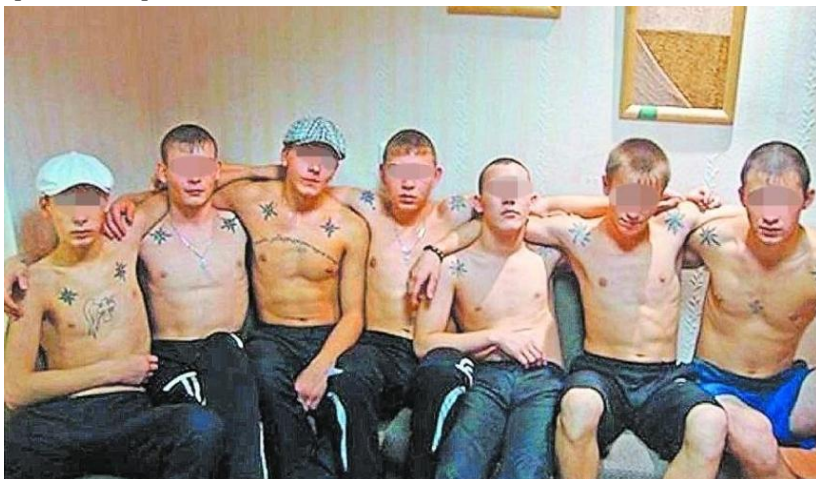
Типові представники субкультури «АУЄ».

злочинські закони. Річ у тім, що головний кістяк субкультури становлять підлітки, які мало що знають про кримінальні традиції та правила і часто здійснюють свавілля та злочини, які є далекими від вчинків реальних злодіїв у законі.