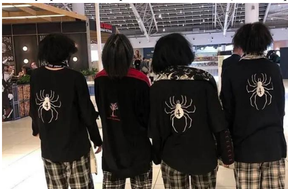
Одяг учасників «ПВК Редан».

Серед інших характерних ознак учасників «ПВК Редан»: довге, пофарбоване у темні кольори волосся, чорні оверсайз-лонгсливи із зображеннями павука, мішкваті штани у клітинку. Вважається, що на популяризацію такого стилю одягу вплинув російський бренд hikikomori kai («хікікоморі кай»), який з'явився на ринку ще у 2020 році.